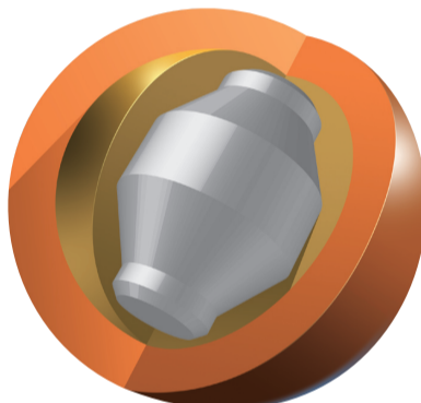
一方、マイボールのコアは、ボールによって全く違う複雑な形をしています。